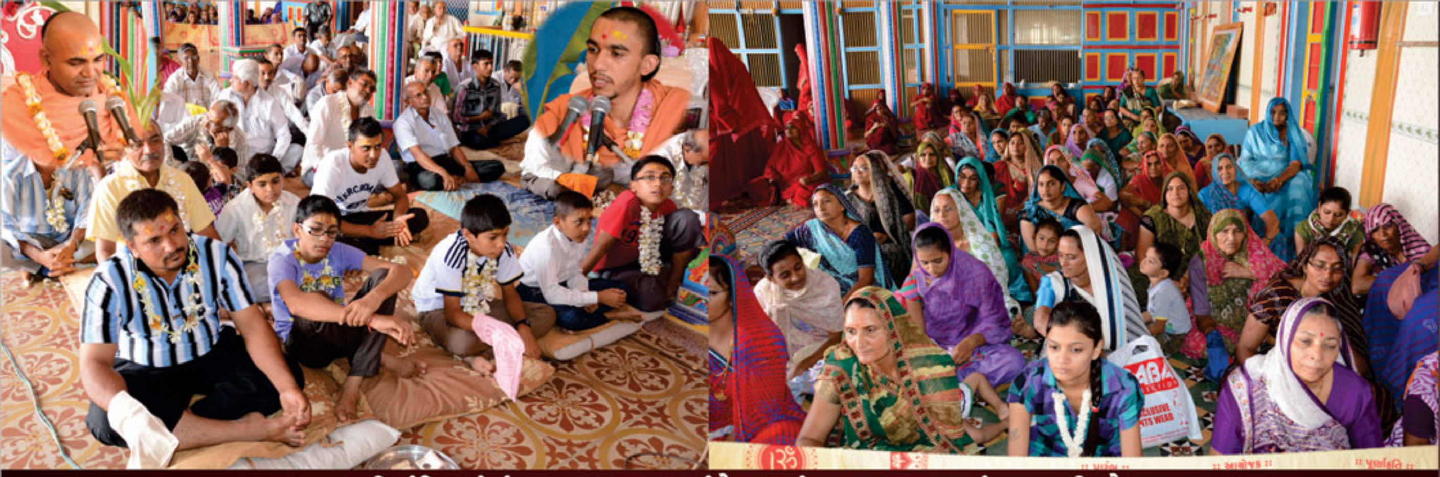
પ્રસાદી મંદિરમાં પંચાલ પારાયણ પ્રસંગે કથાનું રસપાન કરાવતાં વક્તાશ્રીઓ તથા કથામૃતનું રસપાન કરતા સત્સંગી ભાઈઓ તથા બહેનો