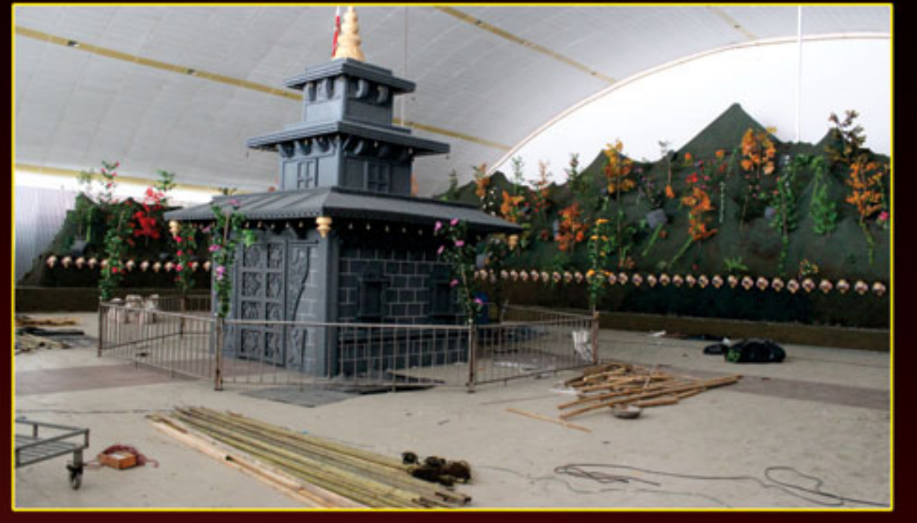
શ્રી સ્વામિનારાયણ મંદિર ભુજમાં હિંડોળા ઉત્સવ પ્રસંગે તા. ૨-૮-૨૦૧૩ ના ભવ્ય અને દિવ્ય પુલહાશ્રમ મુક્તિનાથ ઉદ્ઘાટન