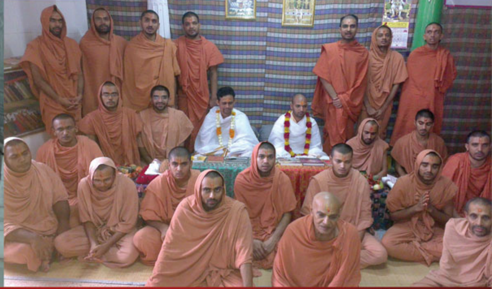
શ્રી સ્વામિનારાયણ સંસ્કૃત પાઠશાળામાં વિદ્યાર્થી સંતો દ્વારા વિદ્યાગુરૂ પૂજન બાદ વિદ્વાનો તથા વિદ્યાર્થી સંતો તથા સંચાલકો