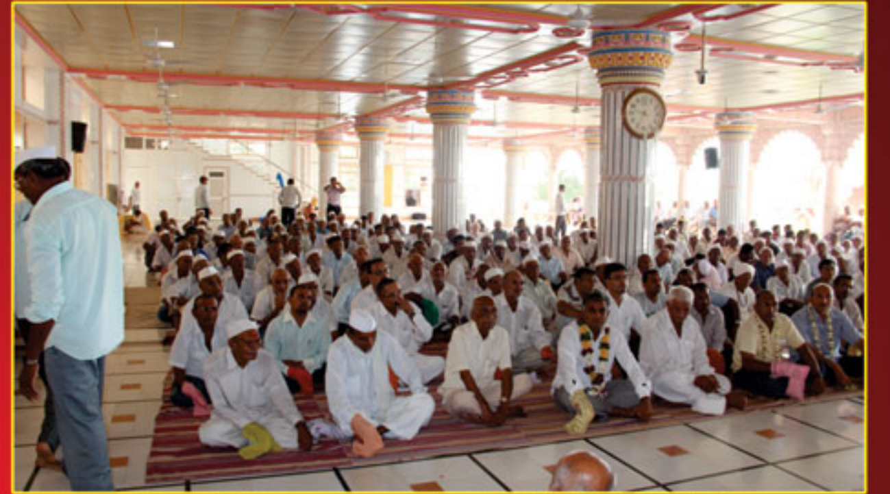
વિલ્સડન રજત જયંતિ મહોત્સવ તથા પાટોત્સવ પ્રસંગે ભુજ મંદિરમાં સમાહ પારાયણમાં ઉપસ્થિત સંતો તથા ગામે ગામના હરિભક્તો - ભુજ