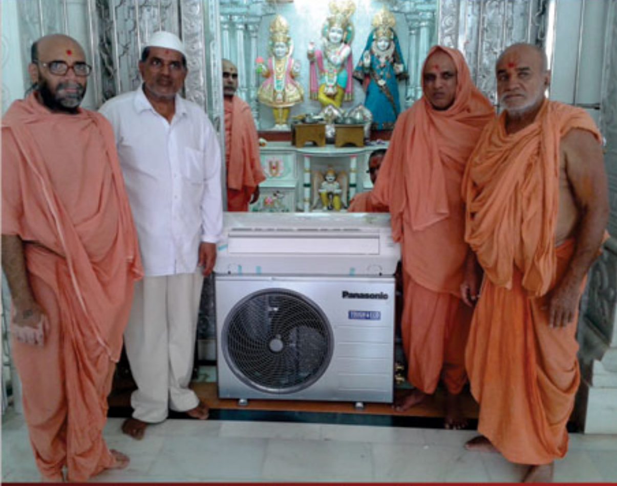
પ્રસાદી મંદિરમાં ઠાકોરજીને અ.ઈ. અર્પણ કરતાં પ.ભ. કાનજીભાઈ - રોહા સુખપર