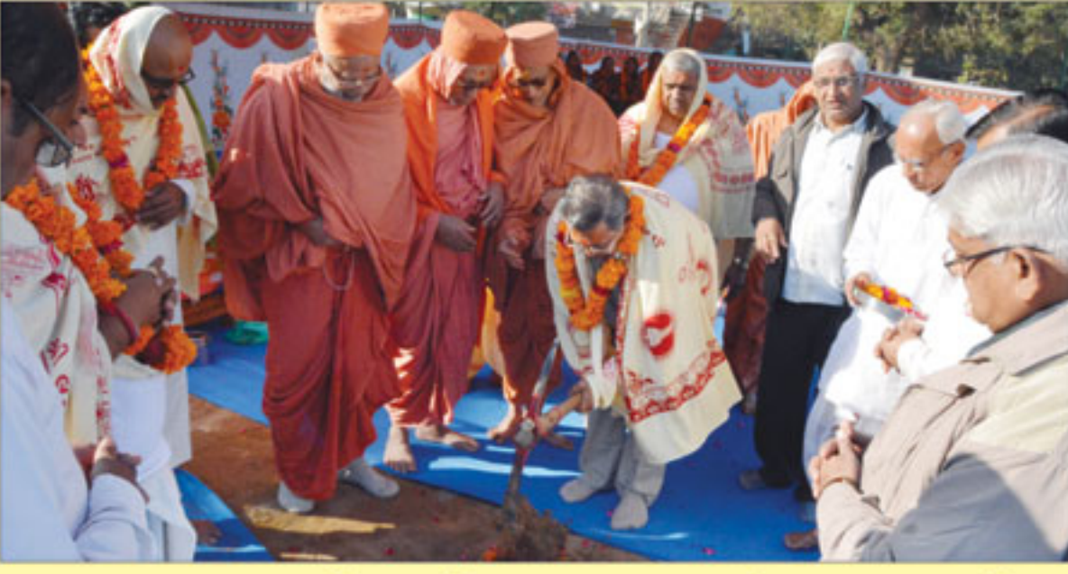
શ્રી સ્વામિનારાયણ સત્સંગ ભવન નડિયાદનું ભૂમી પૂજન કરતા યજમાનો સાથે સંતો - નડિયાદ