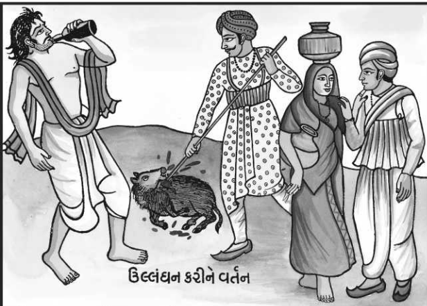
ઉલ્લંઘન કરીને વર્તન