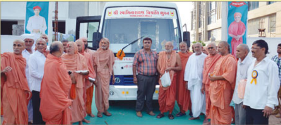
શ્રી સ્વામિનારાયણ વિશ્રાંતિભવન ગાંધીનગર (ભાટ) દેશ-વિદેશથી આવતા ભક્તો માટે લઈ આવવા-જવા સજ્જ ગાડીઓ તથા યજમાનશ્રીઓ સાથે સંતો - ગાંધીનગર (ભાટ)