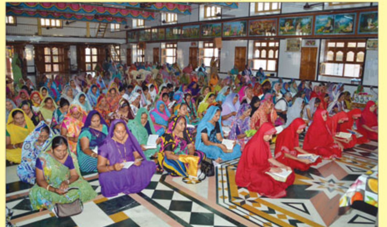
વચનામૃત જયંતી દિવસે પારાયણ કરતા બહેનો - ભક્તિનગર.