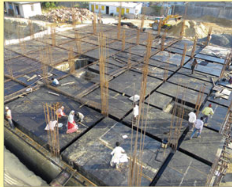
શ્રી સ્વામિનારાયણ મંદિર રાપરનું પુરજોશમાં ચાલતું નવા મંદિરનું બાંધકામ