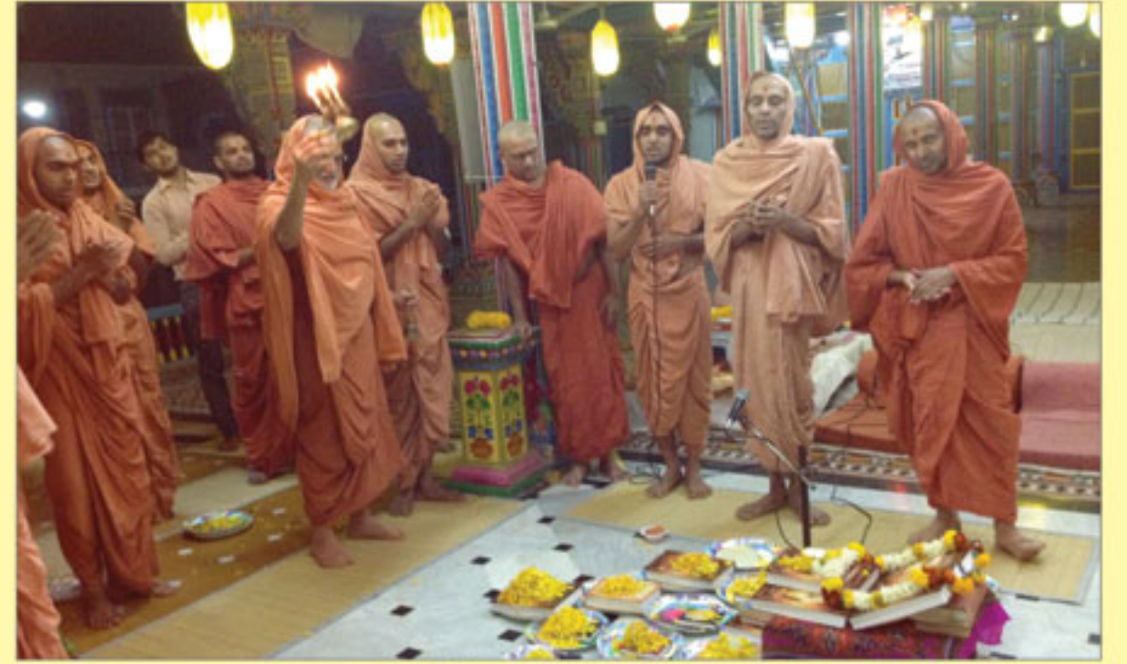
વચનામૃત જયંતી દિવસે વચનામૃત પારાયણ તથા પૂજન - પ્રસાદી મંદિર ભુજ.