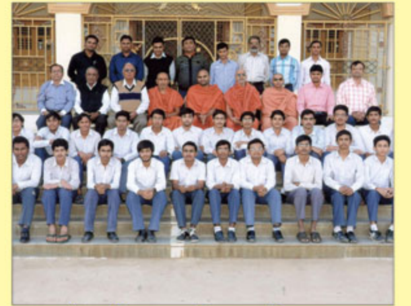
શ્રી સ્વામિનારાયણ વિદ્યાલય વિજ્ઞાનપ્રવાહના ધો. ૧૧-૧૨ સાયન્સના ૯૦% માર્ક્સ મેળવનાર વિદ્યાર્થીઓ સાથે શાળાનો સ્ટાફ, ટ્રસ્ટીગણ તથા સંતો દ્રશ્યમાન થાય છે. - ભુજ