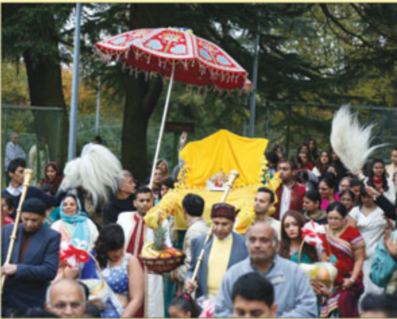
શ્રી સ્વામિનારાયણ મંદિર સ્ટેનમોરમાં તુલસી વિવાહ પ્રસંગે શોભોયાત્રા