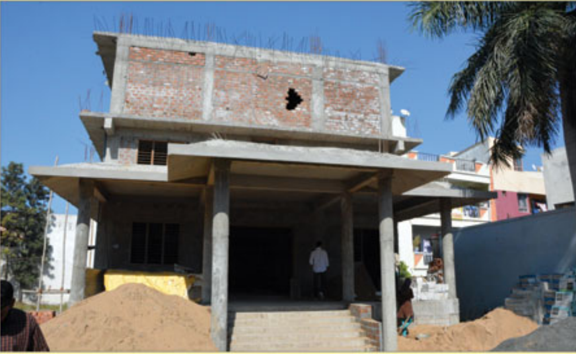
શ્રી સ્વામિનારાયણ સત્સંગ ભવન ઈન્દોરનું થઈ રહેલ બાંધકામ. - મધ્યપ્રદેશ