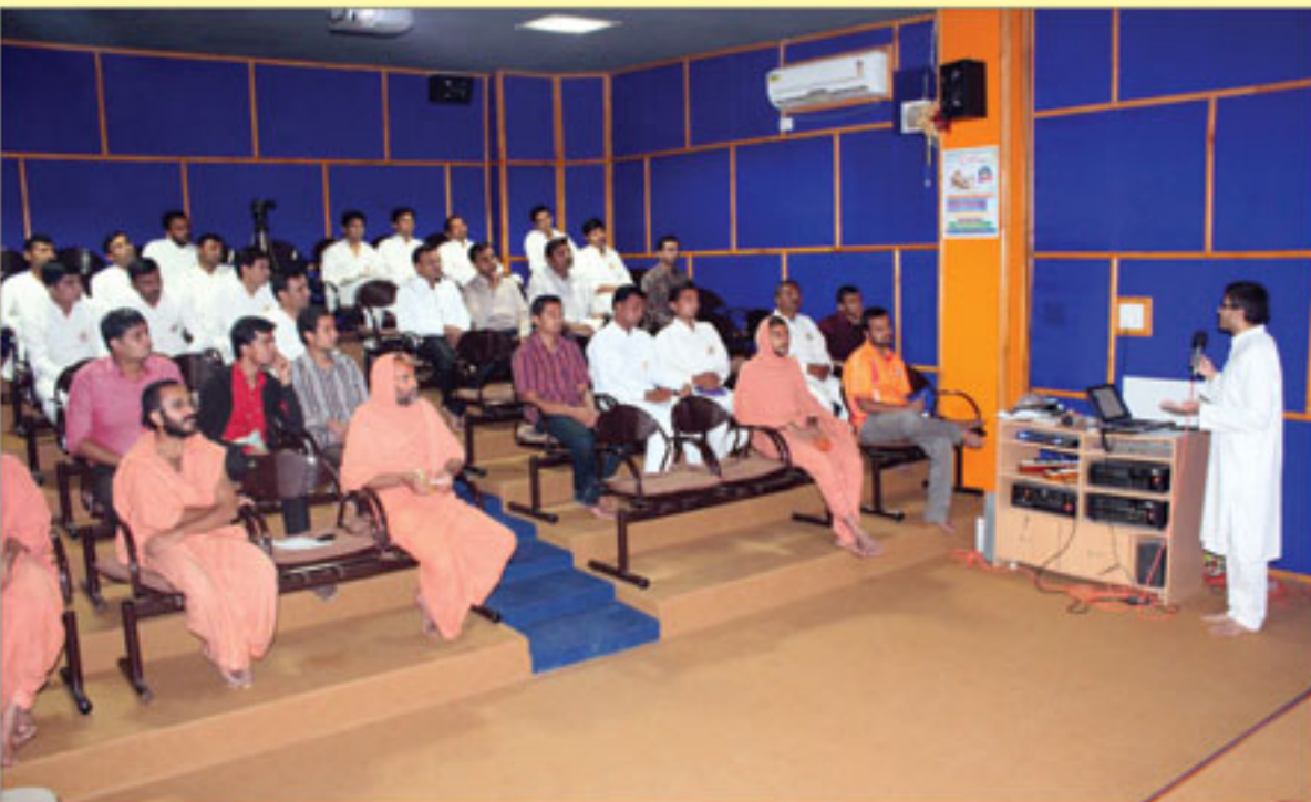
સત્સંગ અભ્યાસ ક્રમનું પ્રશિક્ષણ લેતા યુવાનો - ભુજ.