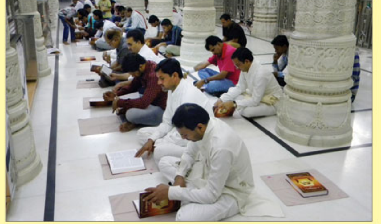
ઠાકોરજી આગળ વચનામૃત જયંતીના દિવસે વચનામૃતની પારાયણ કરતા સંતો તથા હરિભક્તો - ભુજ