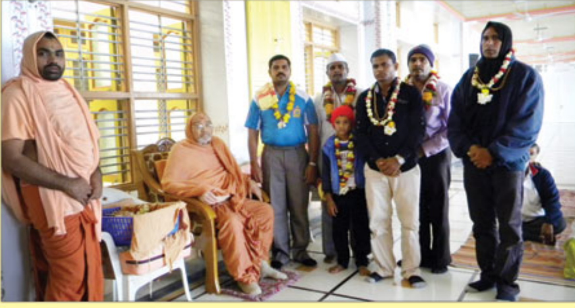
શ્રી સ્વામિનારાયણ મંદિર ભુજમાં પંચાહ પારાયણ દરમ્યાન પ્રસન્તાની પહેરામણી સ્વીકારતા કોડકીના તથા ફોટડીના યજમાનશ્રીઓ પ.પૂ. મહંત સ્વામી સાથે ભુજ.