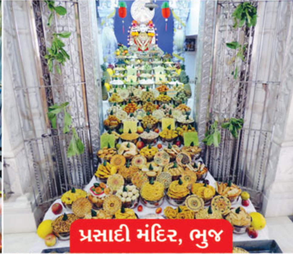
પ્રસાદી મંદિર, ભુજ