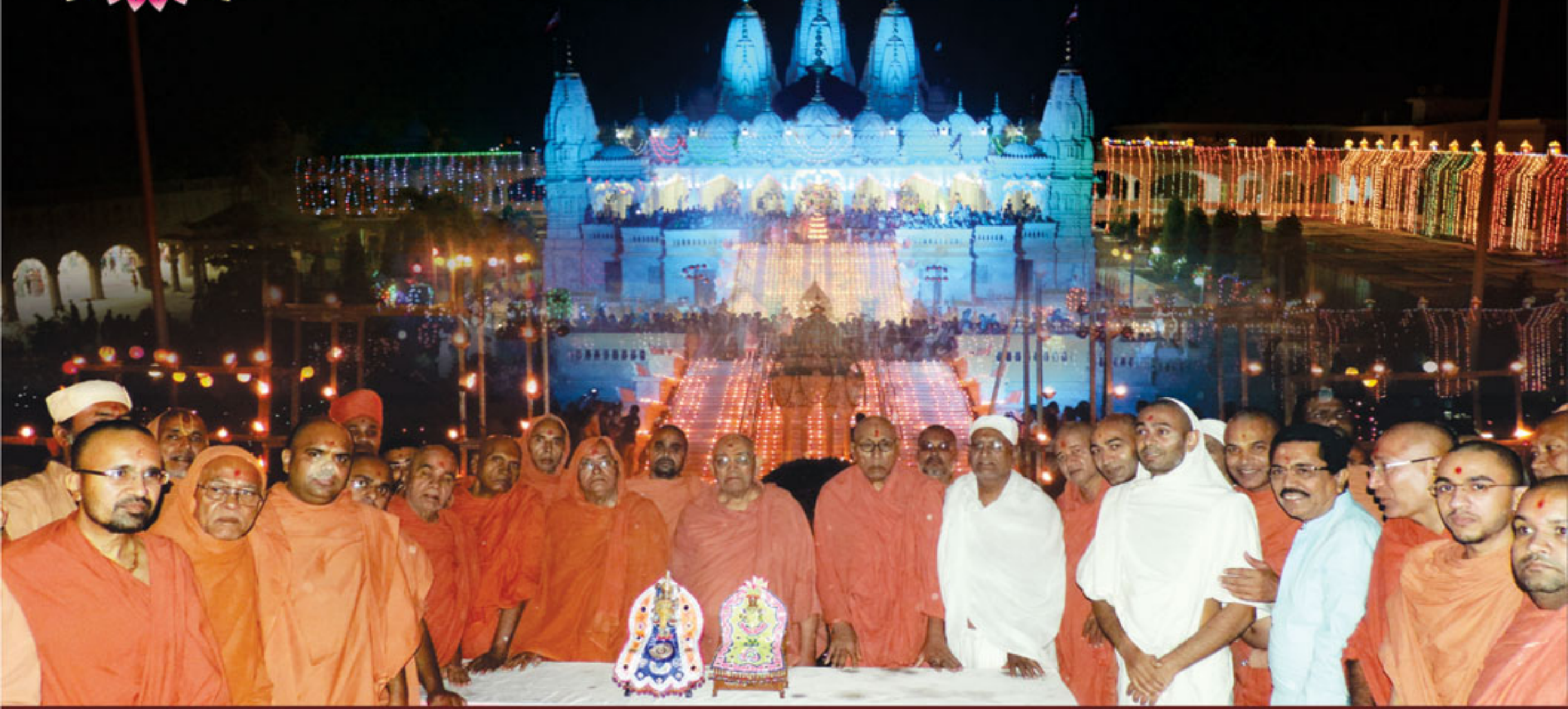
દિવાળીના દિવસે હજારો દિવડાઓ દ્વારા સુશોભિત ભુજ મંદિર