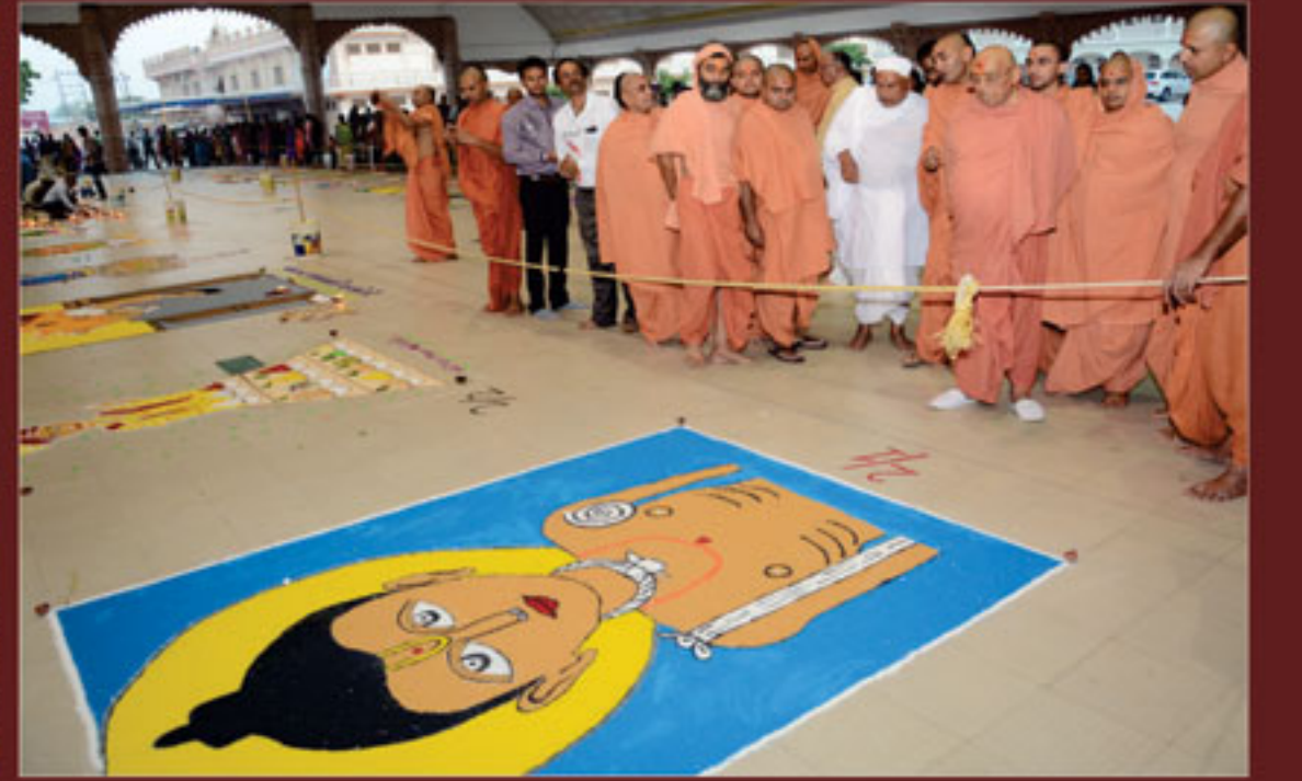
દિવાળીના દિવસે ચુપતીની મંડળની બહેનો દ્વારા બનાપેલ રંગોળીનું નિરીક્ષણ કરતા મહંત સ્વામી, આદિ સંતો-ભુજ