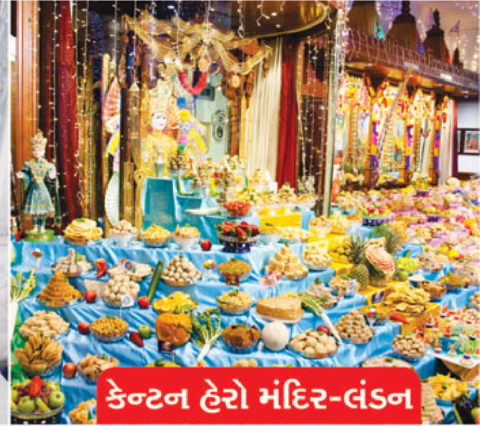
કેન્ટન હેરો મંદિર-લંડન