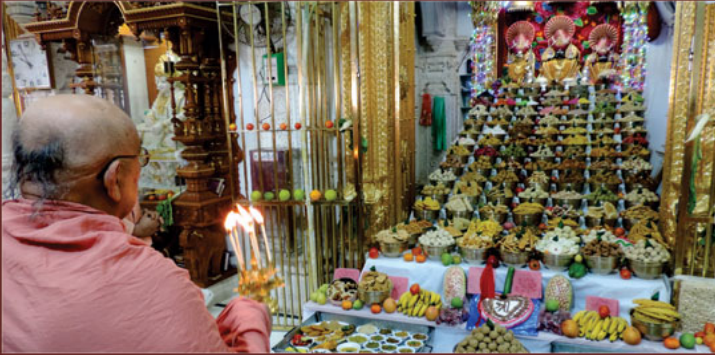
સંવત્ ૨૦૭૨ના નવ વર્ષારંભે અન્નકૂટ દર્શનની આરતી કરતા મહંત સ્વામી, ભુજ