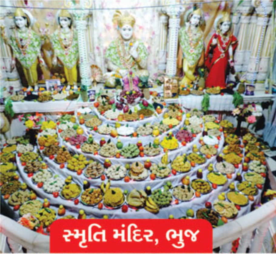
સ્મૃતિ મંદિર, ભુજ