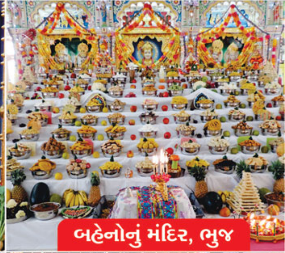
બહેનોનું મંદિર, ભુજ