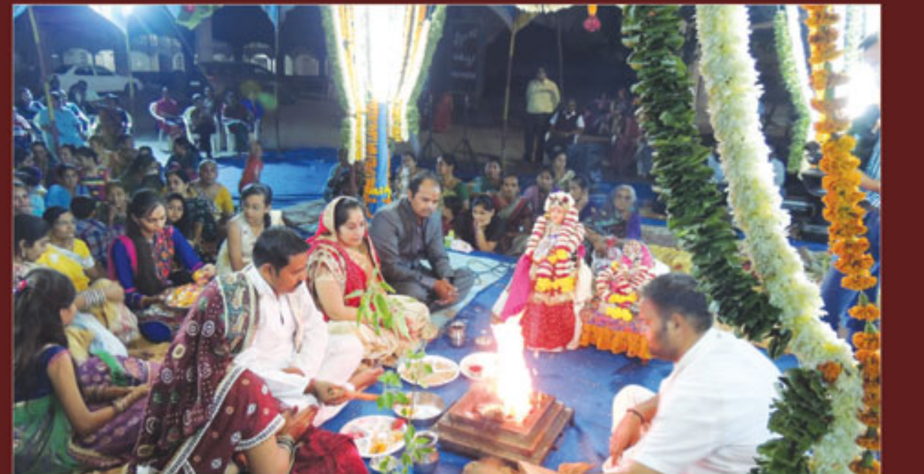
ભુજ મંદિરમાં ધામધૂમથી તુલસી વિવાહ ઉજવાયો.