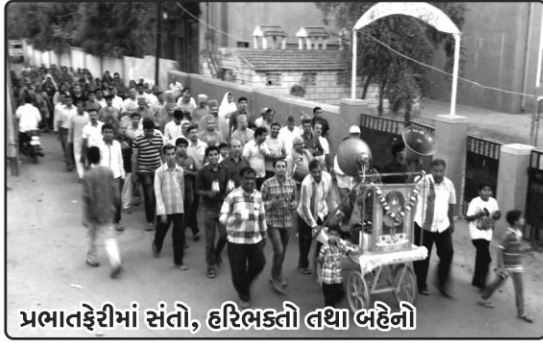
પ્રભાતફેરીમાં સંતો, હરિભક્તો તથા બહેનો

ભુજ શ્રી સ્વામિનારાયણ મંદિરે રામનવમી તથા શ્રી સ્વામિનારાયણ જંચતિ ધામધૂમથી ઉજવણી કરાઈ