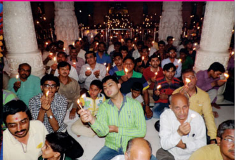
રામનવમી નિમિત્તે ૧૨ કલાની ધૂન કરતા બાળકો તથા સાંજે મહાઆરતીના દર્શન